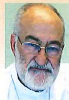
M gr Cristobal Lopez SDB, archevêque de Rabat au Maroc.

coordinateur du réseau DBAS (Don Bosco Action Sociale).