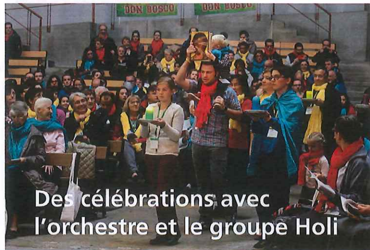
Des célébrations avec l'orchestre et le groupe Holi

Un après-midi à la carte : rando sportive, chemin de croix, jeux, visites, etc.